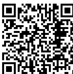
PETITE SALLE 2EME ETAGE